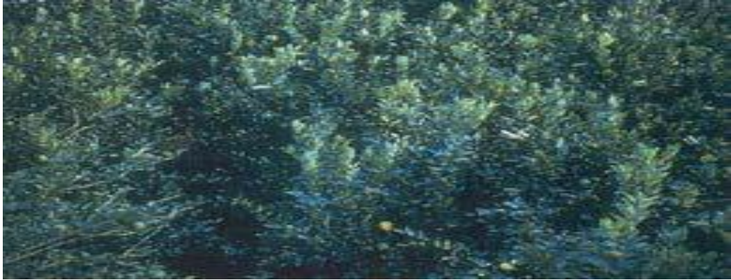
Triệu chứng cây thừa đạm