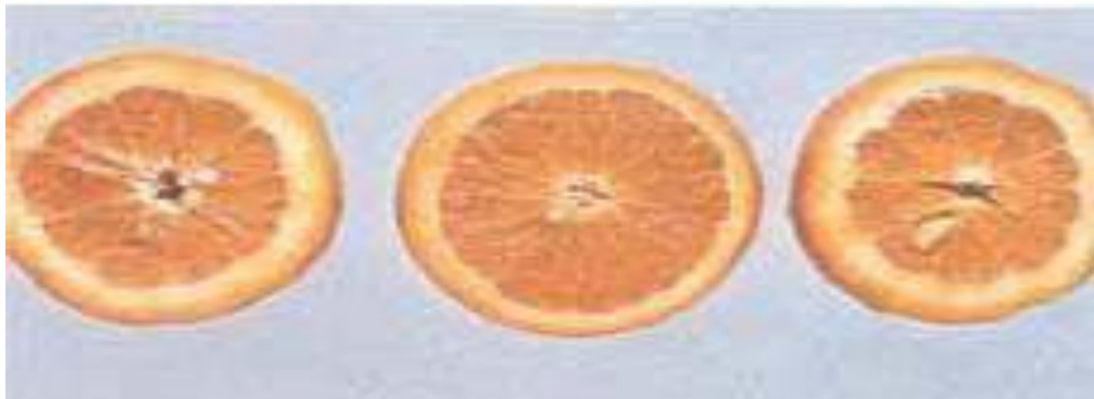
Triệu chứng thiếu lân trên cây cam sành (Bên trái: Quả đủ lân, vỏ cùi mỏng, tép mọng nước; Bên phải: Quả thiếu lân, vỏ cùi dày, lõi rộng và tép khô).

Thừa lân, không gây ra bất kỳ tổn thất nào về năng suất, chất lượng trái cây, nhưng có thể có tác động làm thiếu kẽm trong cây và giảm hiệu quả sản xuất.