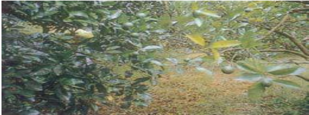
Triệu chứng cây thiếu đạm

Khi cây thiếu đạm (N): Triệu chứng chính là các lá già ở gần gốc cây có màu vàng hoặc xanh nhạt đều, cành nhỏ. Bị thiếu đạm nghiêm trọng gây lá rụng sớm hơn bình thường, sinh trưởng của cây bị đình trệ và quả bị rụng làm giảm năng suất.