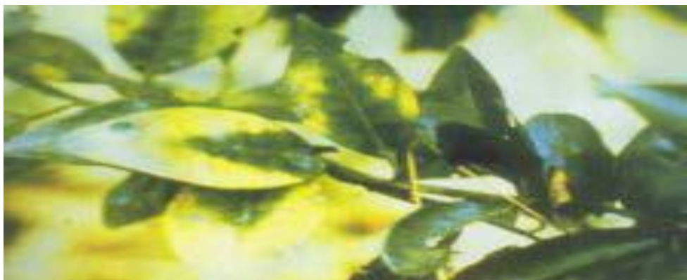
Triệu chứng thiếu Ma giê trên cây cam (Phần lá màu xanh có hình chữ V ngược).

Khi bị thiếu magiê trầm trọng, có thể gây hiện tượng lá rụng sớm. Toàn bộ phiến lá có thể bị chết, trừ gân lá chính và phần phiến lá phía cuống vẫn còn màu xanh. Phần lá còn màu xanh giống hình chữ V ngược. Quả từ cây bị thiếu magiê nói chung nhỏ, có hàm lượng đường và độ axit thấp.