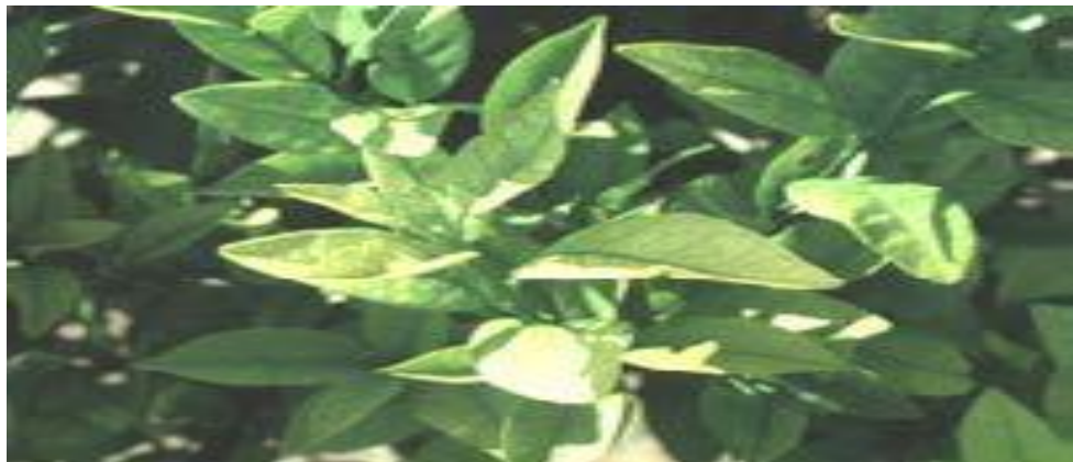
Triệu chứng thiếu sắt

Giống triệu chứng thiếu kẽm, thiếu mangan, chỉ khác những lá non ở phần dưới tán cây thường biểu hiện rõ. Thiếu sắt trong trường hợp nhẹ, gân lá có màu xanh tối, xuất hiện ở lá non. Trong trường hợp thiếu sắt trầm trọng, lá non dần dần chuyển sang màu vàng, các lá non phát triển sau này sẽ trở nên trắng, cây có thể rụng lá chết cành. Thiếu sắt thường xuất hiện ở cây ăn quả có múi trồng trên đất thoát nước kẽm hoặc đất.