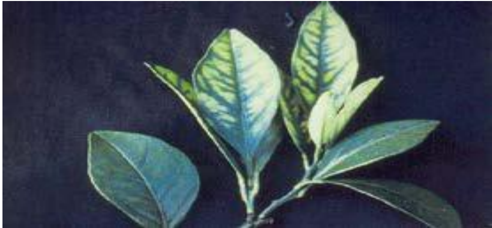
Triệu chứng thiếu kẽm trên cây non

các gân lá. Triệu chứng này giống với triệu chứng bệnh Greening, gây giảm năng suất.