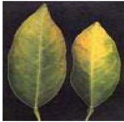
Hình ảnh thiếu kali trên cây cam

Tình trạng thừa kali sẽ gây hiện tượng thiếu magnê (Mg). K và Mg là 2 nguyên tố dinh dưỡng đối kháng nhau. Khi kali có hàm lượng cao sẽ làm giảm sự hút Mg bình thường. Tình trạng thừa kali sẽ có ảnh hưởng nghịch đối với quả: vỏ quả thô, xù xì và độ axit cao.