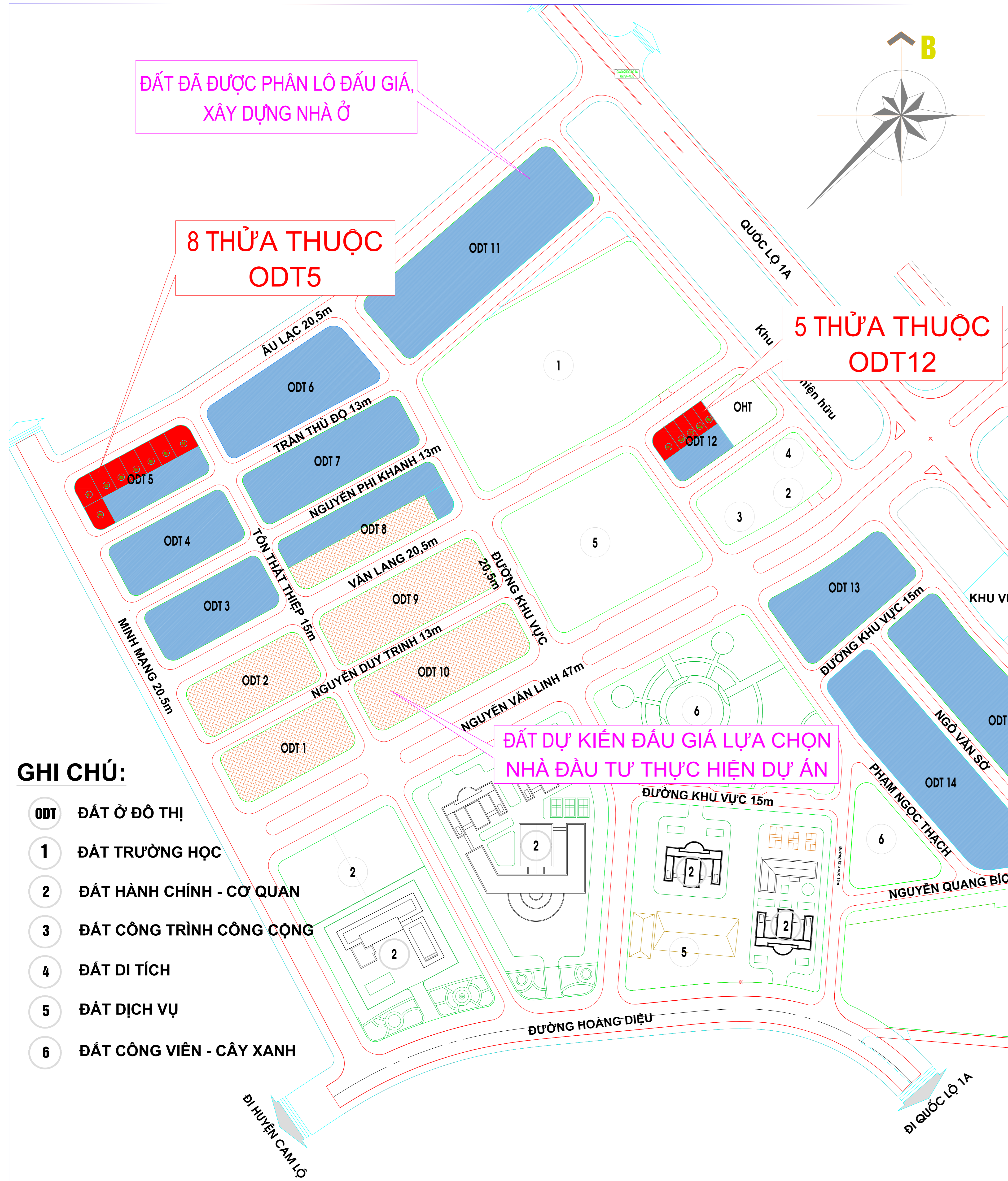
SƠ ĐỒ VỊ TRÍ CÁC KHU ĐẤT: ODT5, ODT12