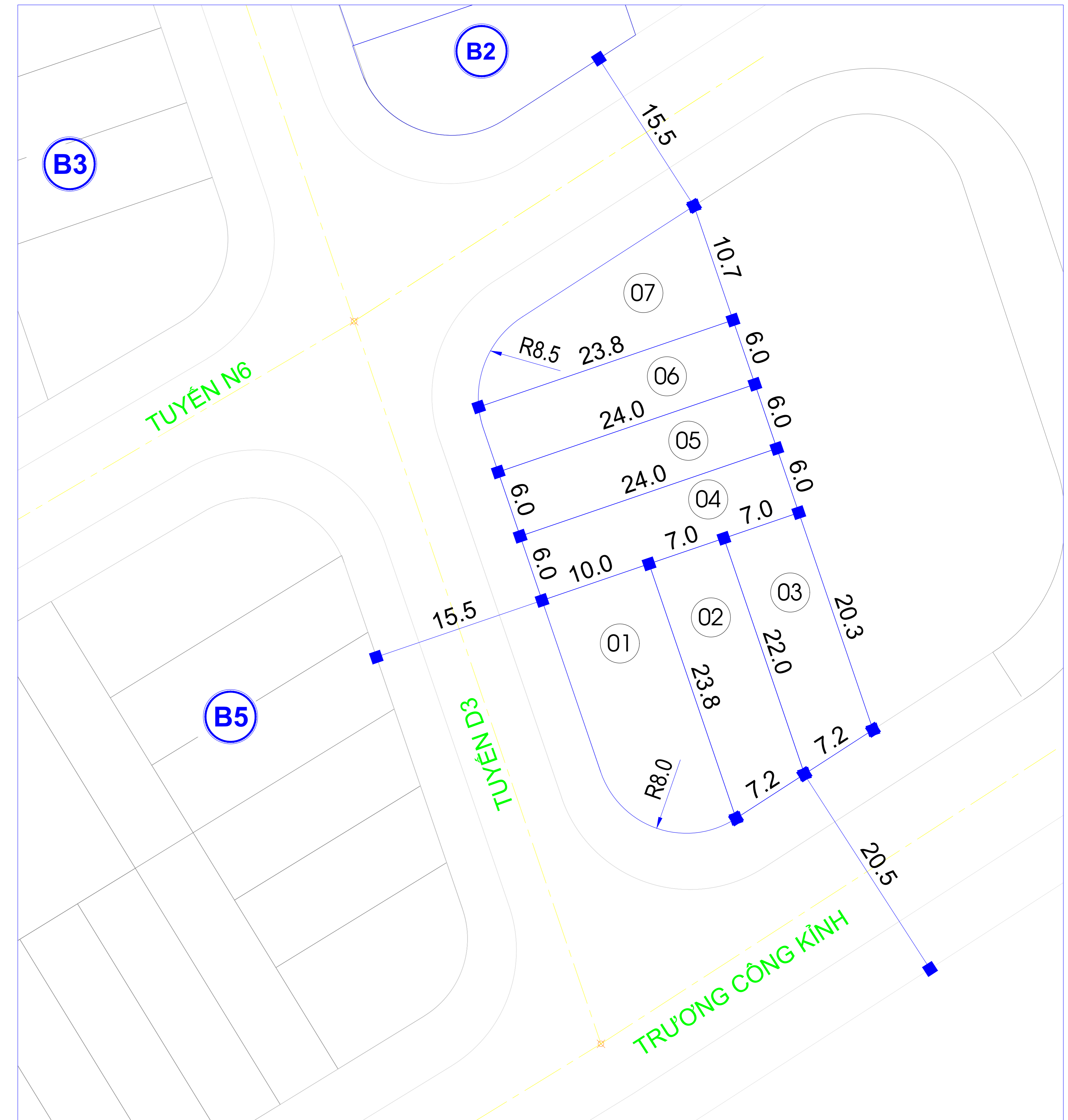
BẢNG TỔNG HỢP PHÂN LÔ